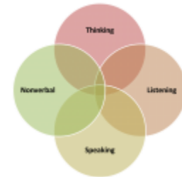
Die Four Communication Skill

As jy dit oorweeg om te skei, moet dit wees om die redes wat God gee. En dit is altyd wanneer iemand 'n onskuldige party is en verraai word.